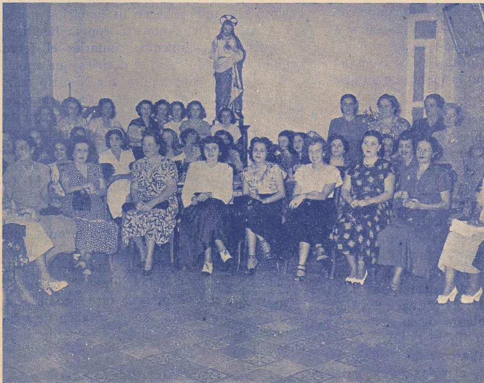
Después del saludo a nuestra Rvda. Madre.