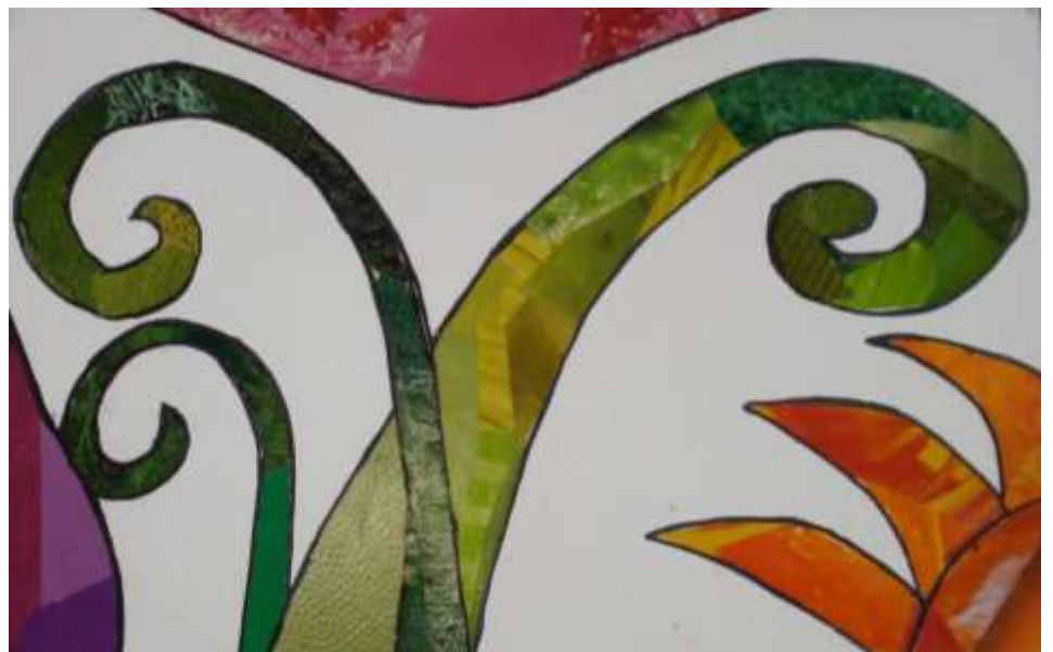
Obra en proceso, ejemplos para el ejercicio Campos de Color