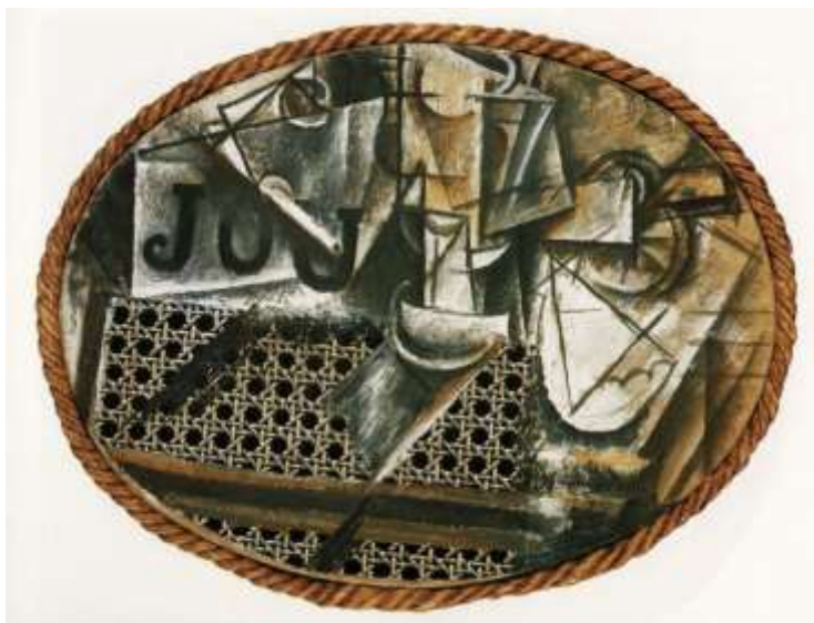
Pablo Picasso, Bodegón con asiento de rejilla , 1912

En este ejercicio: CAMPOS DE COLOR- estaremos trabajando un collage utilizando láminas o recortes de revistas. El collage es una técnica moderna que inadvertidamente fue creada por Pablo Picasso durante sus experimentos creativos en la época de germinación del Cubismo. En sus procesos de descomponer la forma, Picasso estuvo a punto de cruzar el umbral hacia el arte abstracto. Por temor a perder el total contacto con la realidad, tomó una soga y un pedazo de pajilla y la incorporó al lienzo. Creó lo que se conoce como collage.