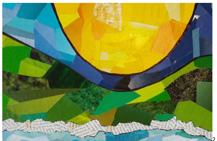
1 Ejemplo para el diagrama que divide el formato en 5 grandes zonas