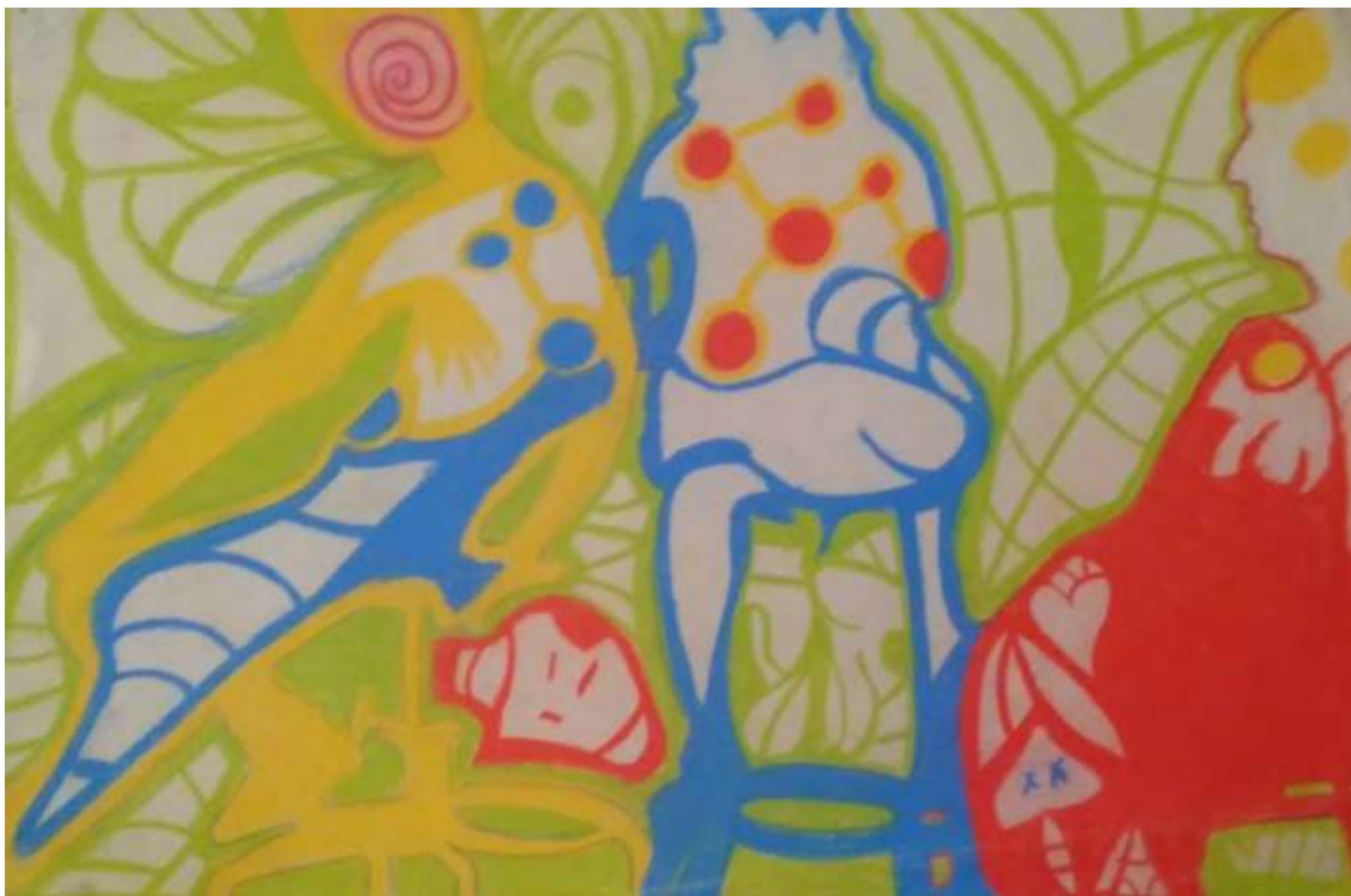
Dibujo de estudiante para el ejercicio FIGURA, espacio negativo. Curso Fundamentos del Dibujo, Profa. Torrech

La fecha de cierre para este ejercicio es el próximo lunes 30 de marzo . Ese día entregan obra terminada y se les presentará el próximo ejercicio a trabajar. Este miércoles 25 deben enviar ejercicio en proceso para crítica y comentarios.