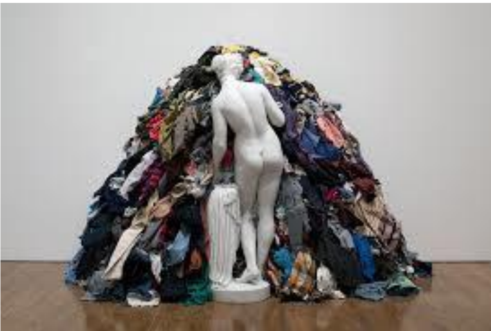
Venus in rags de Michelangelo Pistoletto, principal exponente del Arte Povera en Italia. Varias versiones de 1967 a 1974