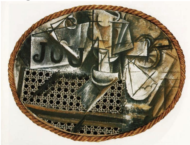
Pablo Picasso, Bodegón con asiento de rejilla , 1912

La apropiación es un fenómeno del arte moderno que se extiende hasta nuestros días. Pablo Picasso inmerso en sus procesos creativos durante el Cubismo llegó al borde de lo que hoy conocemos como el arte abstracto. Temiendo perder total contacto con la realidad, tomó una sogá, un pedazo de pajilla y la incorporó al lienzo. Creó de este modo el collage .