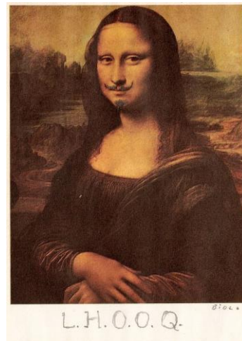
LHOOQ de Marcel Duchamp, 1919

Marcel Duchamp, creador de los ready mades interviene una reproducción de la Gioconda, le dibuja bigote con chiva y añade en la parte de abajo las letras LHOOQ, que al ser pronunciadas en perfecto francés leen de la siguiente manera: ella tiene un trasero caliente .