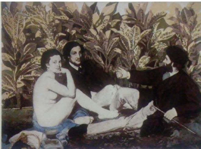
En el patio de mi casa , serigrafía de Myrna Báez, 1980

Los artistas de la plástica local también han trabajado la apropiación. A principios de la década de los '80 Myrna Báez desarrolla una serie de serigrafías donde utiliza detalles de clásicos de la pintura europea y los inserta en contextos locales. En el ejemplo que presento, Báez toma las figuras que aparecen de la controversial pintura al óleo del francés Eduard Manet: Almuerzo sobre la hierba de 1862, los imprime en serigrafía y los inserta en un ambiente tropical de crotones, titula la obra: En el patio de mi casa .