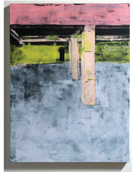
Vacío existencial Acrílico y yeso sobre madera 24" x 18" 2019