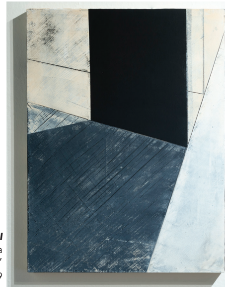
Vestigio II Acrílico y yeso sobre madera 24" x 18" 2019