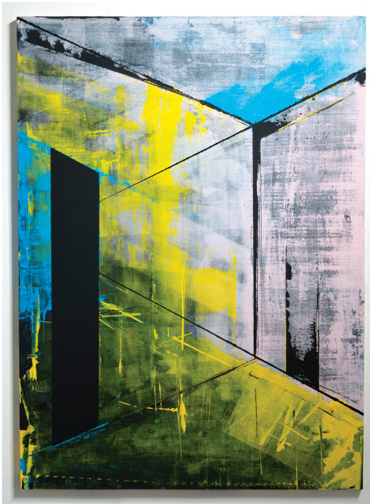
Consciente del inconsciente Acrílico y yeso sobre madera 40" x 30" 2019