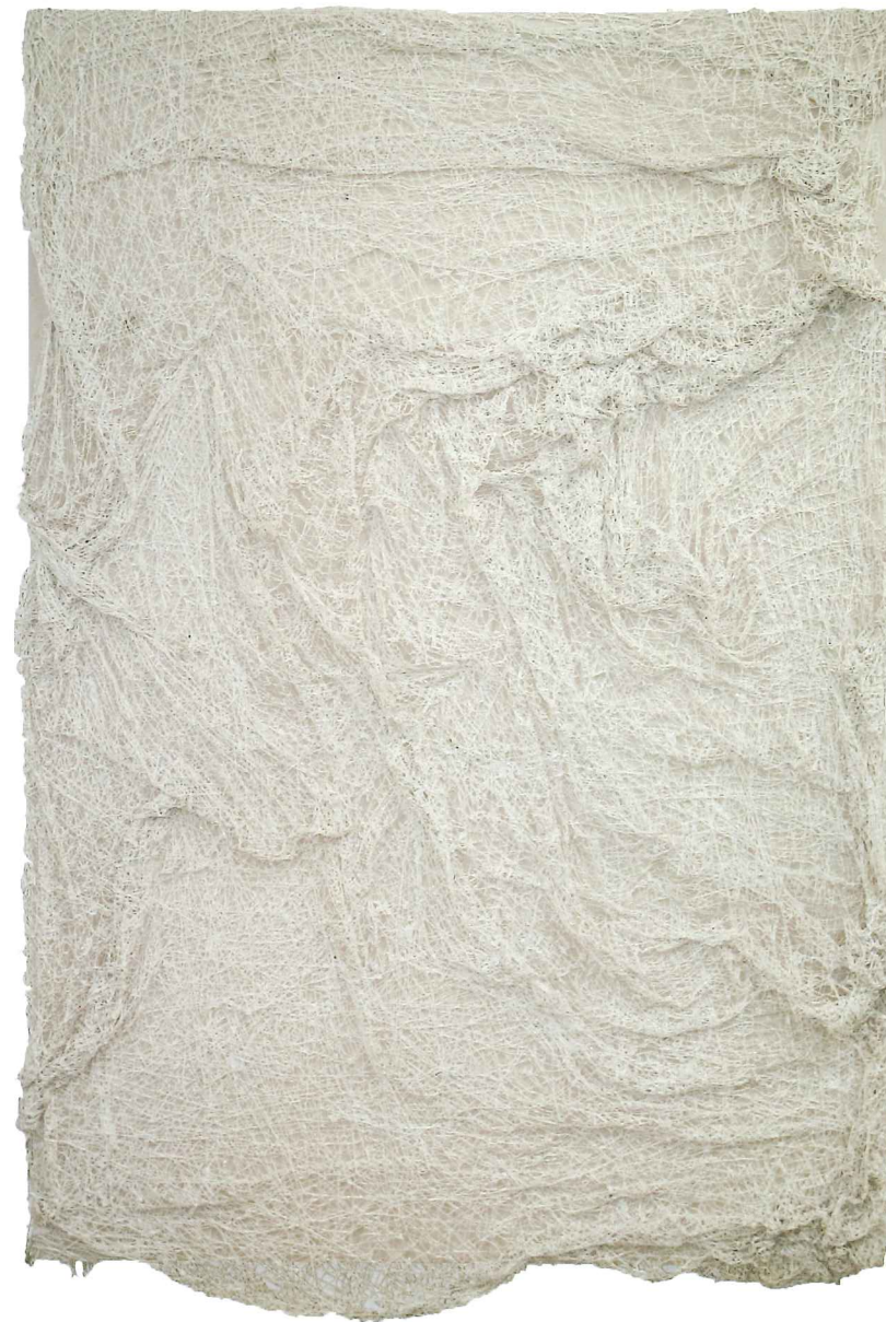
Silvestres II , 72" x 48" x 5", acrilato sobre tela, 2016