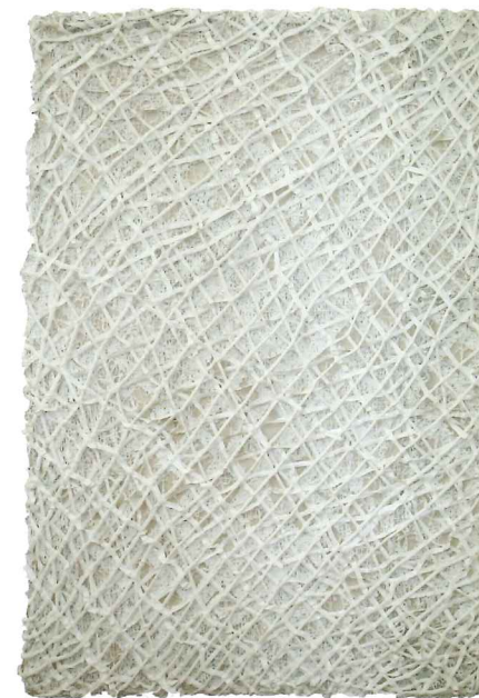
Silvestres I , 72" x 48" x 5", acrilato sobre tela, 2016