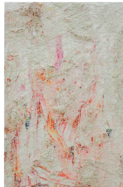
Silvestres IV , 72" x 48" x 5", acrilato sobre tela, 2016