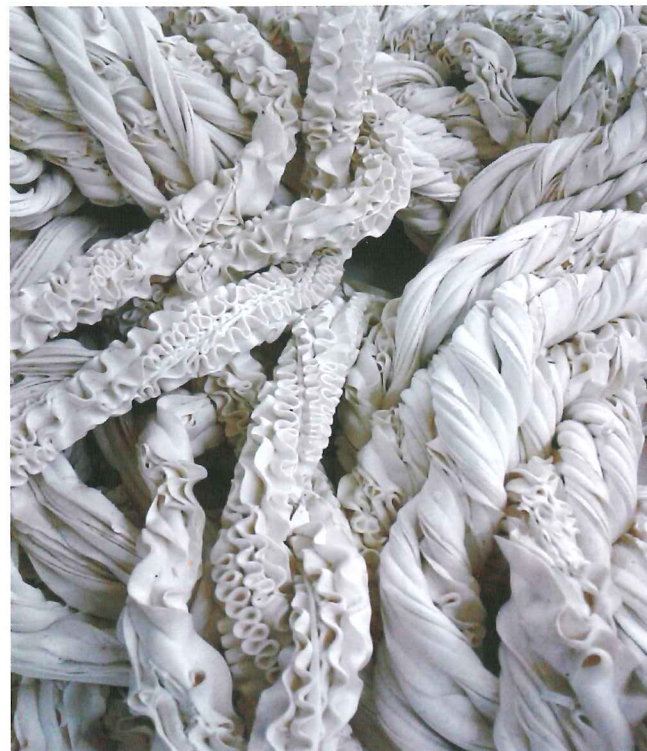
Detalle de Silvestres (escultura) 20' x 6", acrilato, 2015-16