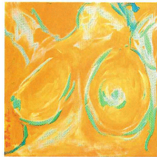
El deleite del fruto