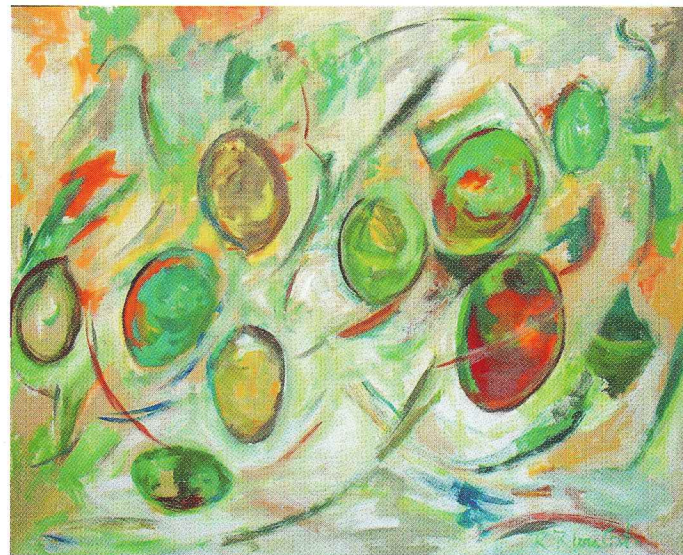
Obra: La Fructificación