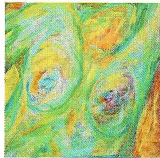
La Fruición II