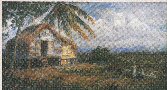
S.T. ( Bohío ), 1920