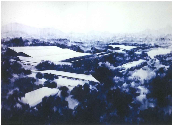
Figure 1756, bolígrafo, acrílico y lápiz de color sobre papel, 76" x 100", 2015