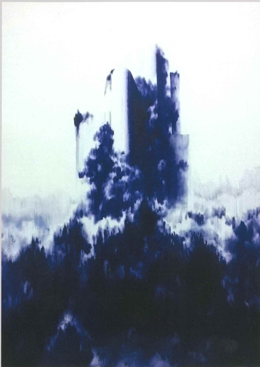
Figure 1761. Bolígrafo, acrílico y lápiz de color sobre papel, 50" x 38" (2015)