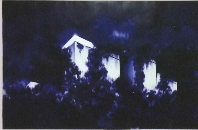
Figure 1763, bolígrafo, acrílico y lápiz de color sobre papel, 50" x 76", 2015