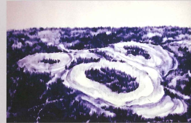
Figure 1752, bolígrafo, acrílico y lápiz de color sobre papel, 40" x 60", 2015