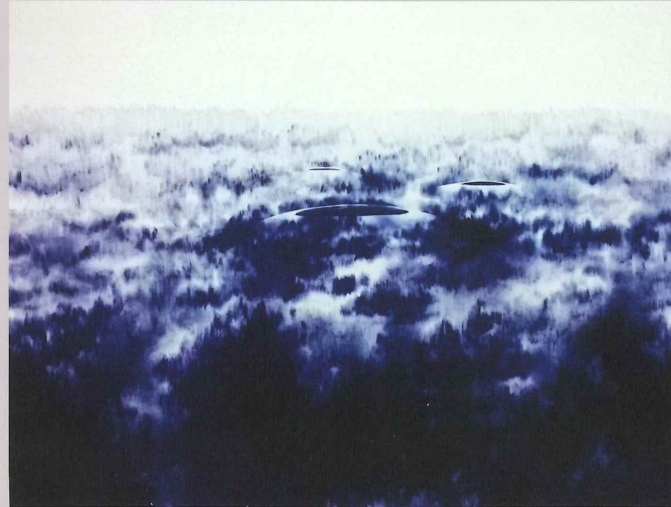
Figure 1758, bolígrafo, acrílico y lápiz de color sobre papel, 38" x 50", 2015