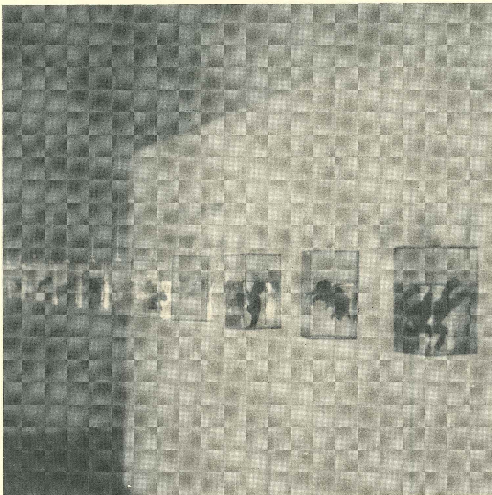
después del arca...1 1996 cajas plásticas, animales plásticos y agua dimensión variable