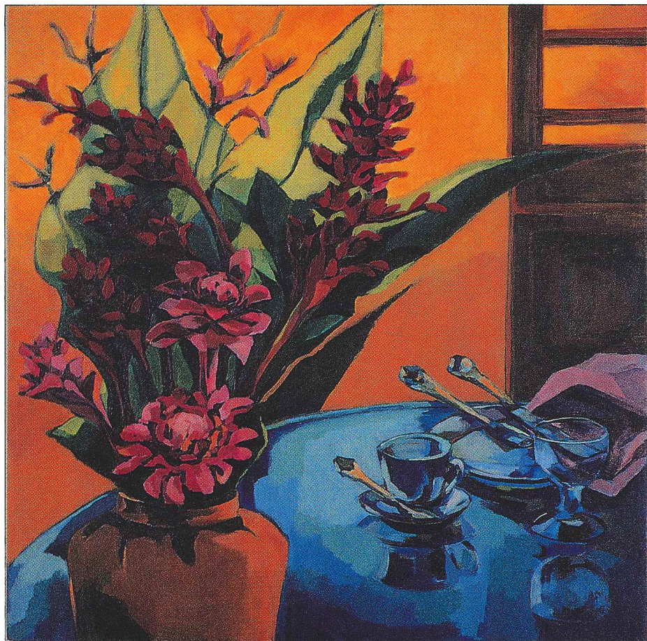
DESAYUNO acrílico 36 x 36 1998