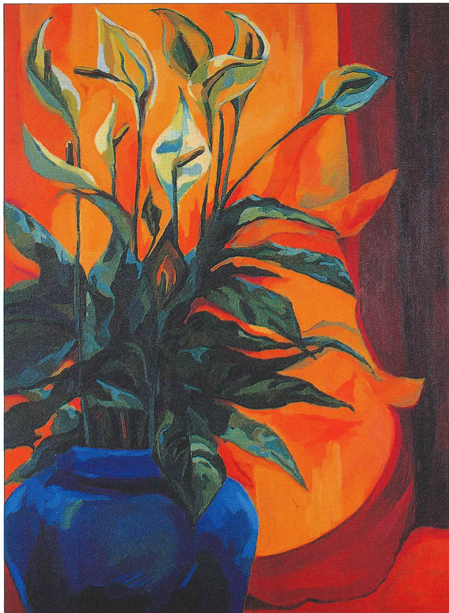
ENERGÍA II acrílico 36 x 48 1998