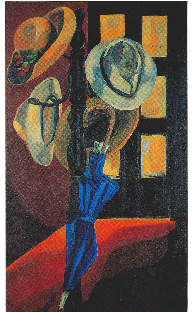
EXIT acrílico 36 x 60 1998