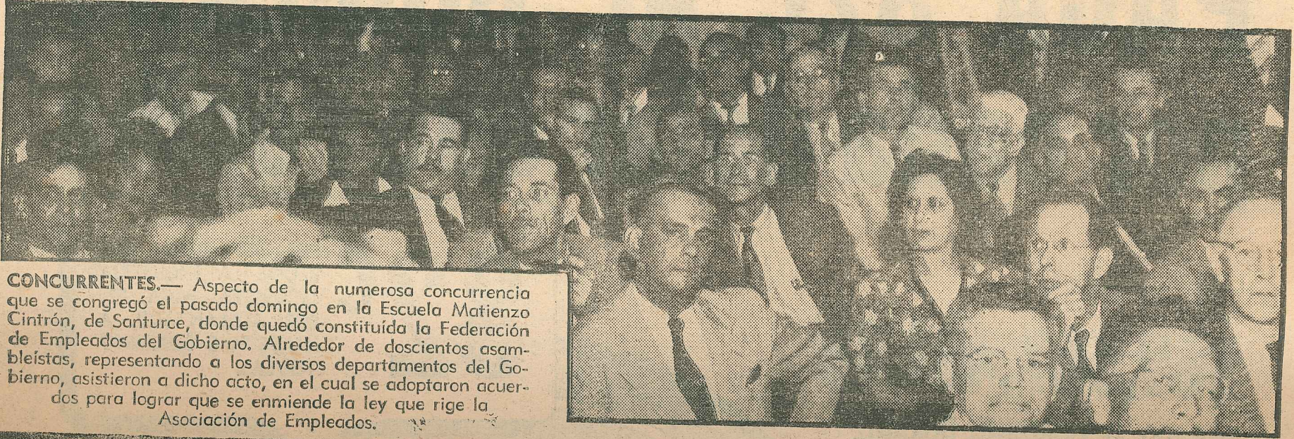
CONCURRENTES. — Aspecto de la numerosa concurrencia que se congregó el pasado domingo en la Escuela Matienzo Cintrón, de Santurce, donde quedó constituida la Federación de Empleados del Gobierno. Alrededor de doscientos asambleístas, representando a los diversos departamentos del Gobierno, asistieron a dicho acto, en el cual se adoptaron acuerdos para lograr que se enmiende la ley que rige la Asociación de Empleados.