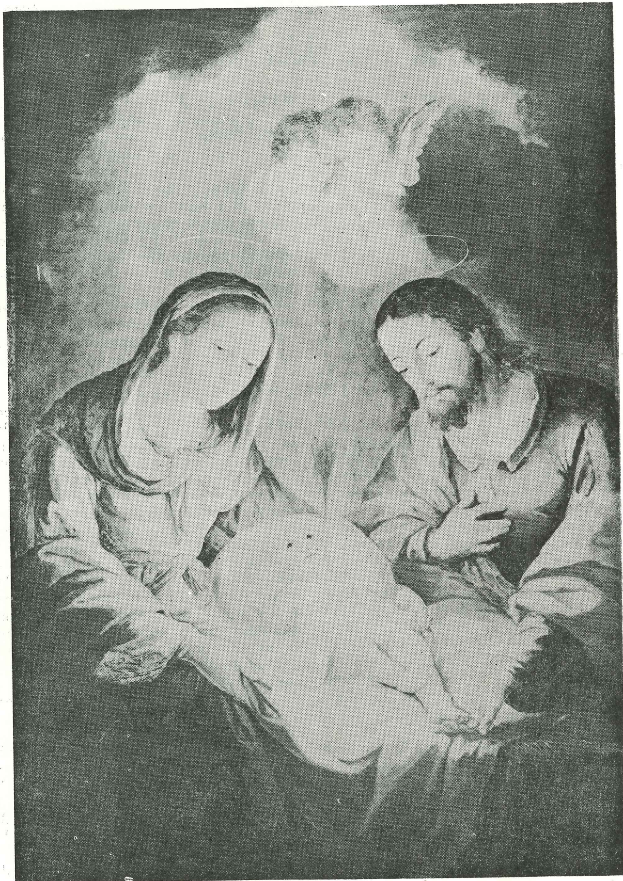
José Campeche—La Sagrada Familia (El Nacimiento). (Obispado de San Juan)