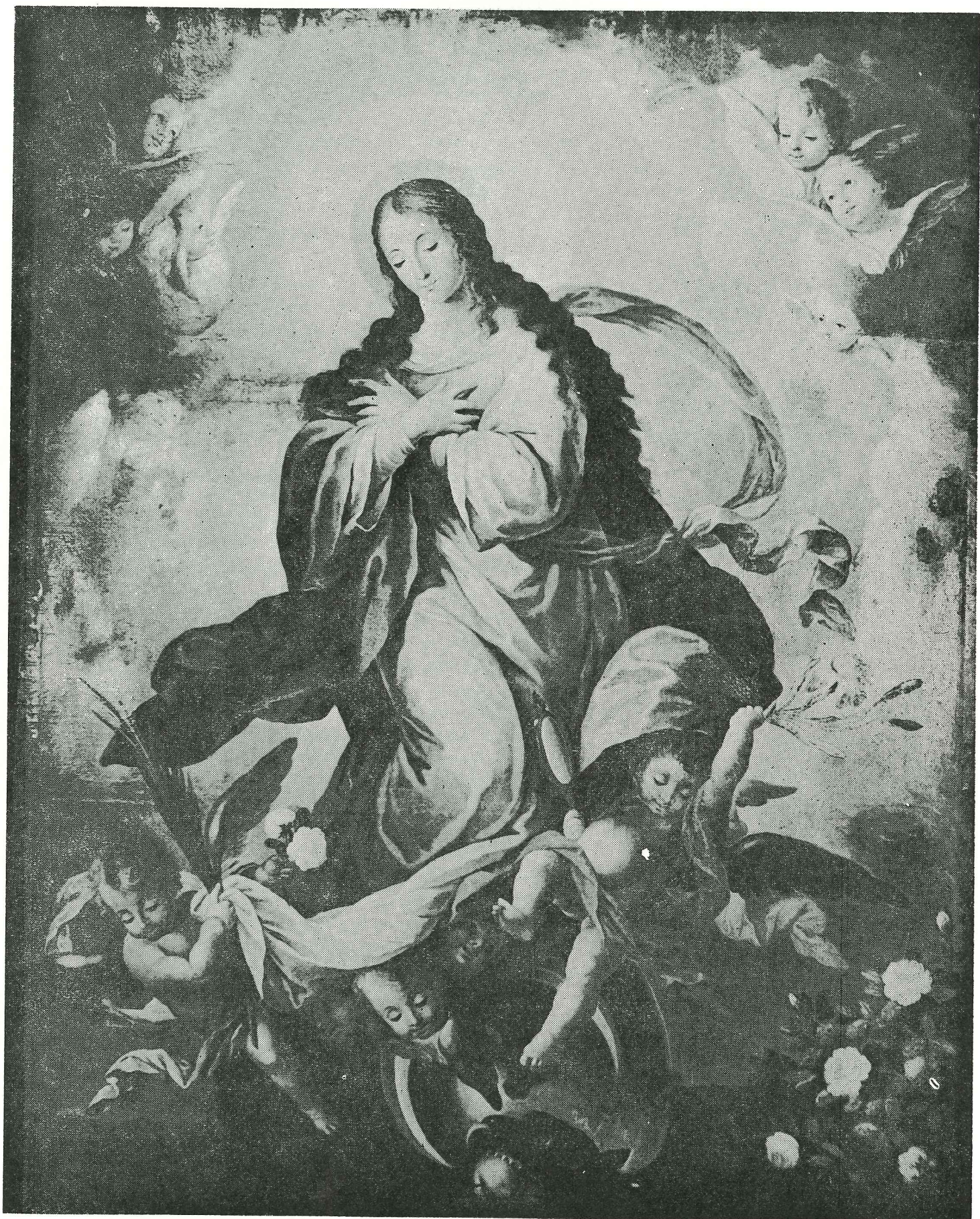
José Campeche—La Purísima Concepción. (Obispo de San Juan).