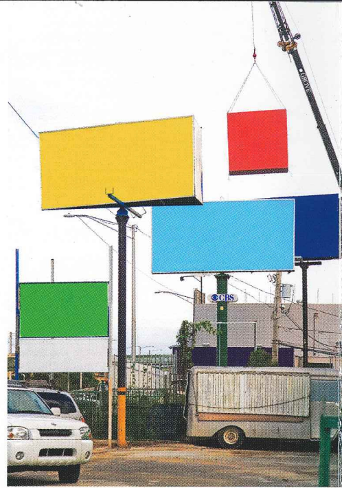
2- Color field, 2008

Como cierre del año académico 2008-2009, la Galería de Arte de la Universidad del Sagrado Corazón se place en presentar una exposición de arte joven acorde al tiempo y espíritu de nuestros clientes principales: los estudiantes universitarios.