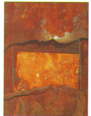
Tríptico "Evolución" 1995 madera, metal, tela y papel 36" x 50"