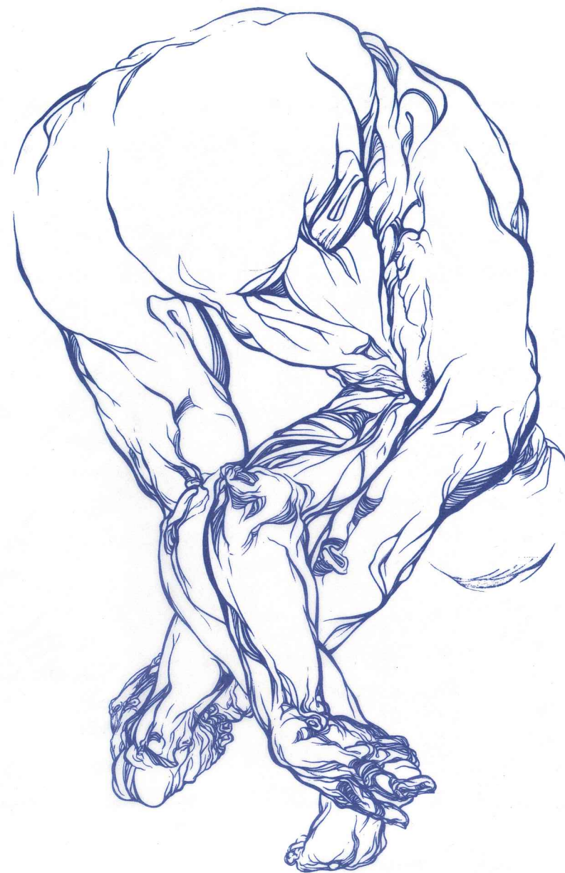
corpo superbo I