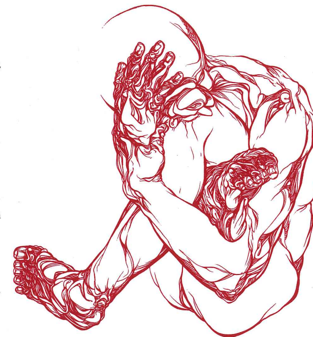
il pensatore II

Grabado Contemporáneo, Casa de las Américas, La Habana, Cuba