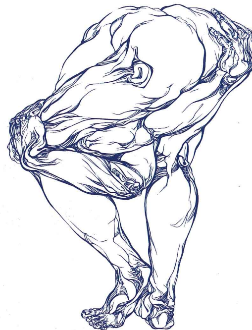
corpo superbo II