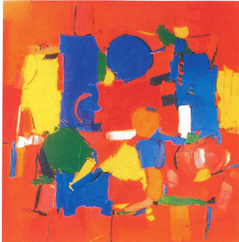
90-35 Red 40" x 40"

La década de los años 50 en Puerto Rico es sinónimo del nacimiento de la generación de artistas que desarrolló un lenguaje plástico figurativo centrado en el tema de nuestra gente, nuestro pueblo y nuestras costumbres. Instituciones como la División de Educación a la Comunidad, el Centro de Arte Puertorriqueño y la Galería Campeche fueron medios para la gestación de esta nueva formulación plástica.