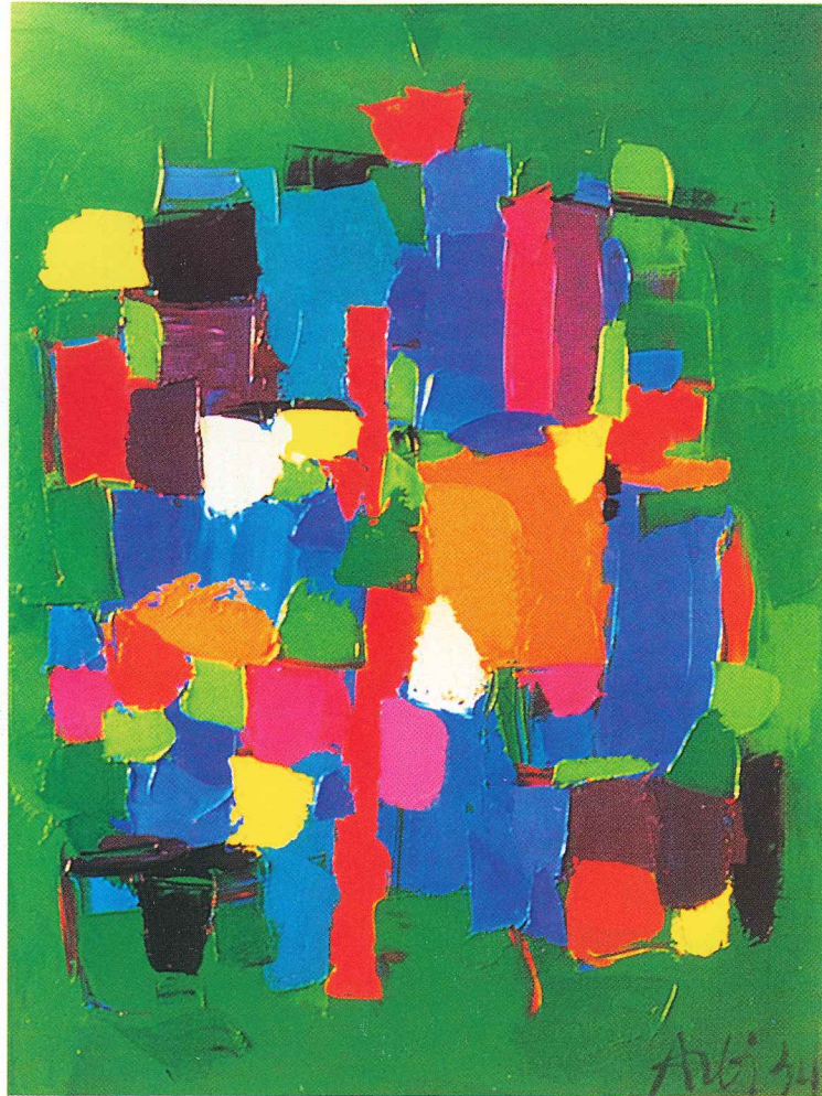
205-13 Green 36" x 40"