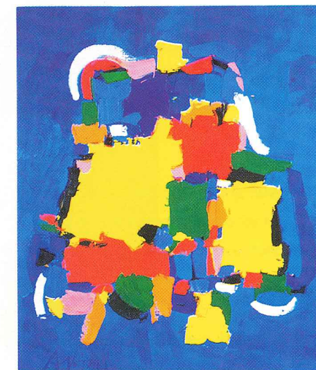
100-70 Blue 36" x 42"