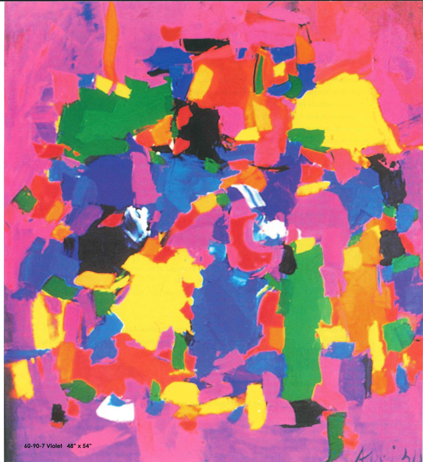
60-90-7 Violet 48" x 54"