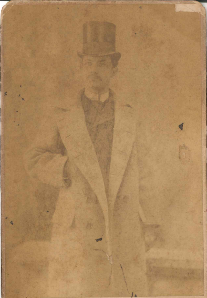
PERKINSON, NEW YORK & NEWARK.