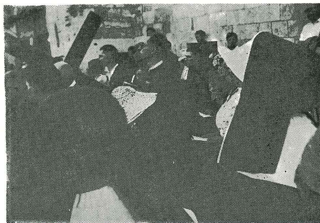
Un viernes a las 3:00 P.M. haciendo el Via Crucis en la Vía Dolorosa en Jerusalén.