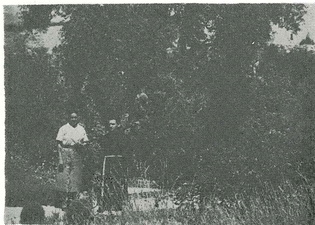
Huerto de Getsemaní