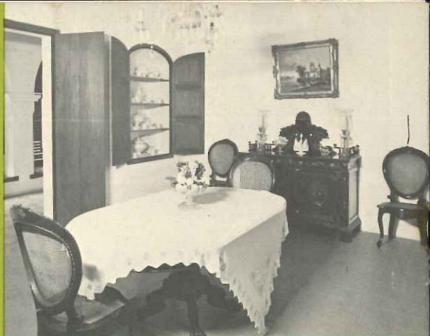
El comedor y, abajo, el despacho. Dining room and, below, the den.