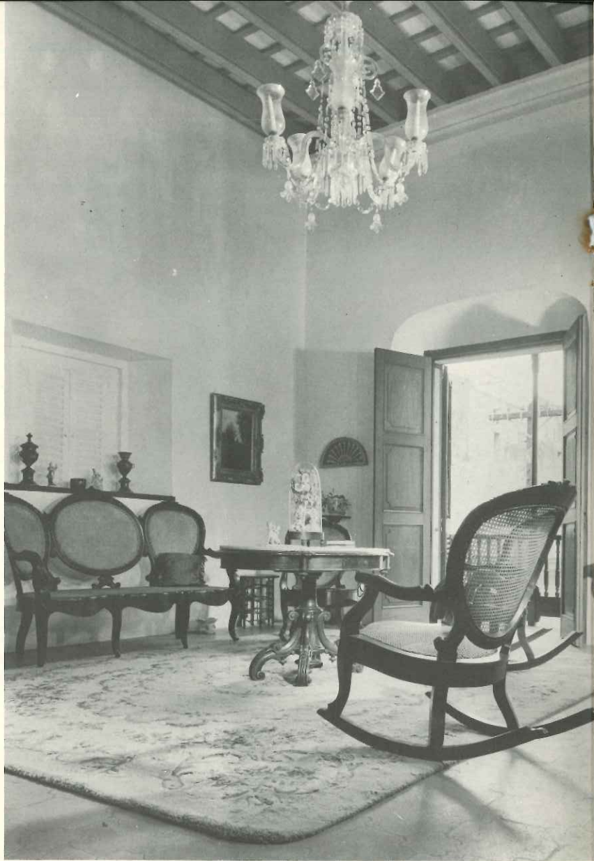
La sala de la casa-museo. The living room of the house-museum.