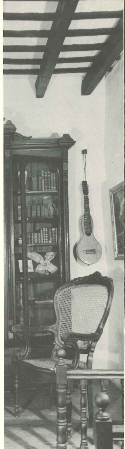
Angulo del despacho. Corner of the den.

El edificio es sede del Museo de Arquitectura Colonial de San Juan (planta baja) y del Museo de la Familia Puertorriqueña del Siglo 19 (altos). En la planta baja también están instalados la galería de grabados puertorriqueños "Colibrí", la Librería del Instituto de Cultura Puertorriqueña, un centro de exposi-